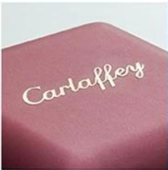
metal logo sticker