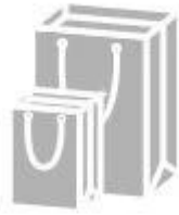
Jewelry paper bag