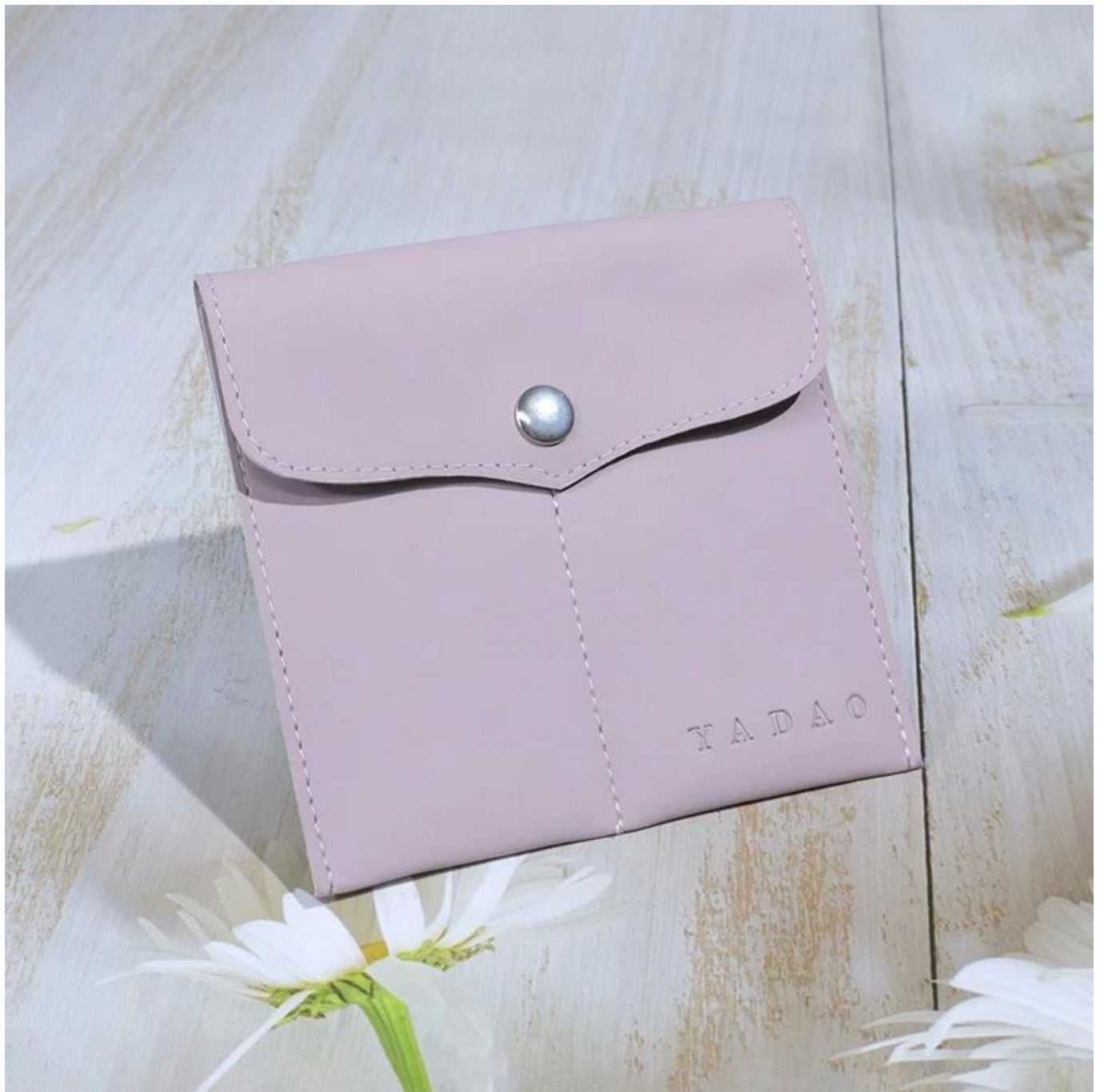
▣ Le bureau de Yadao ▣