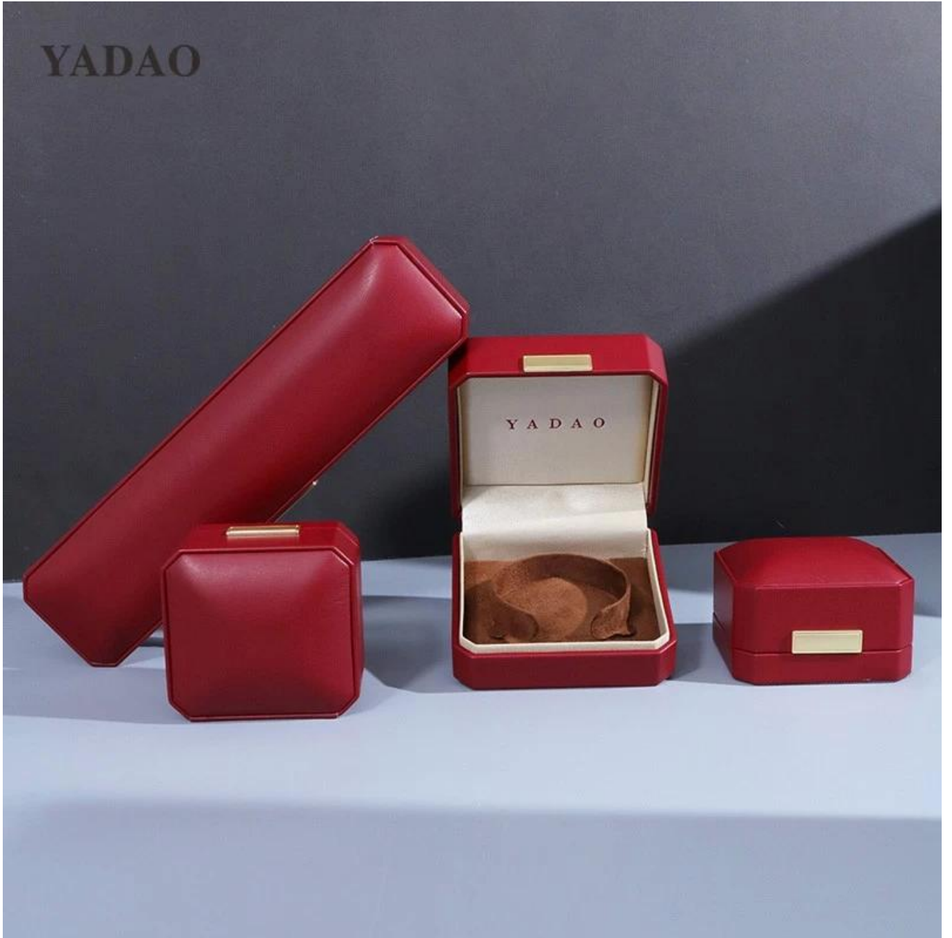
□ Le bureau de Yadao □