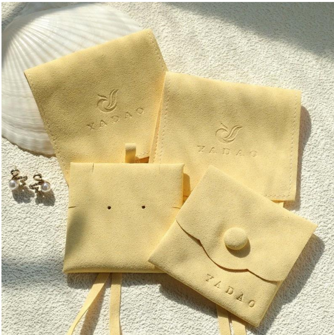
▣ L'ufficio di Yadao ▣