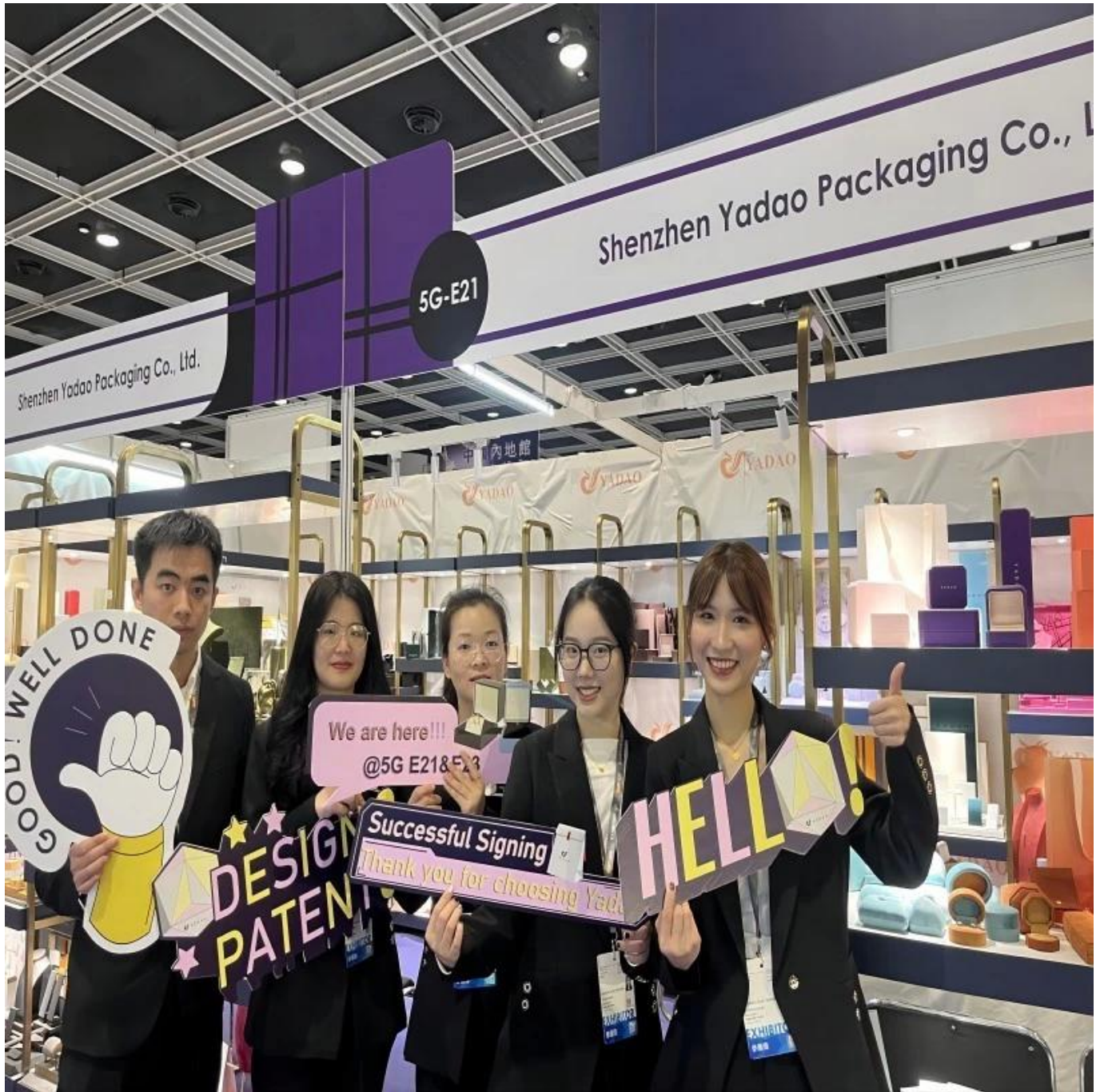
Embalagem e entrega