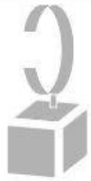
Jewelry display stand